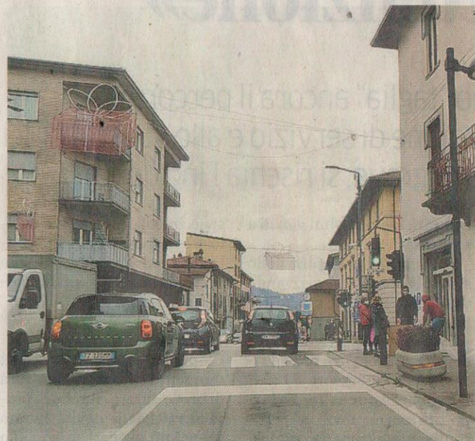
Lavori a Calolzio per l'apertura di una panetteria-pasticceria