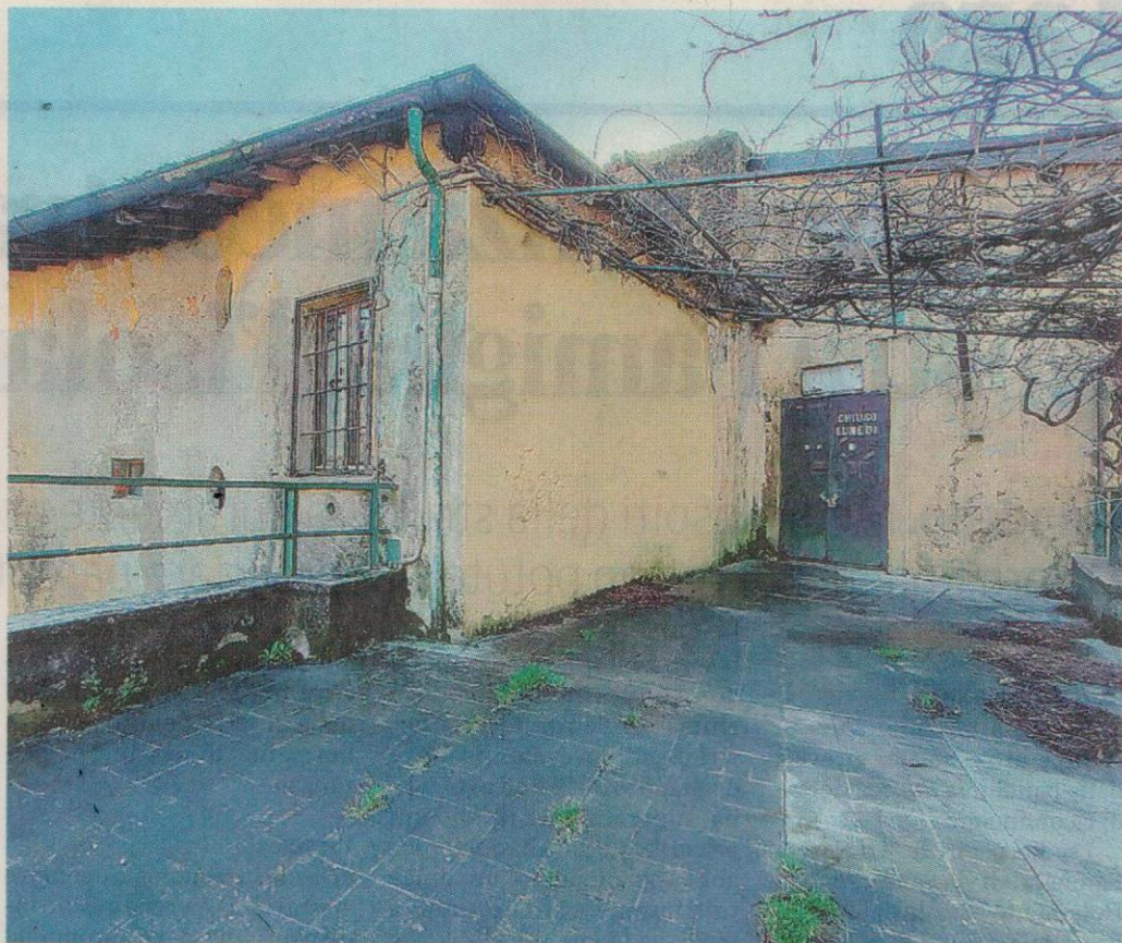
La vecchia pizzeria dei "Bravi" oggi luogo di spaccio pronta per essere riqualificata