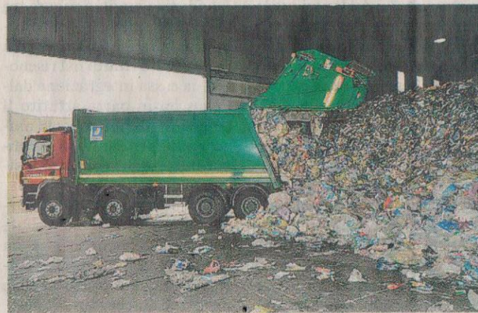
La raccolta differenziata rivestirà ovviamente un ruolo importante