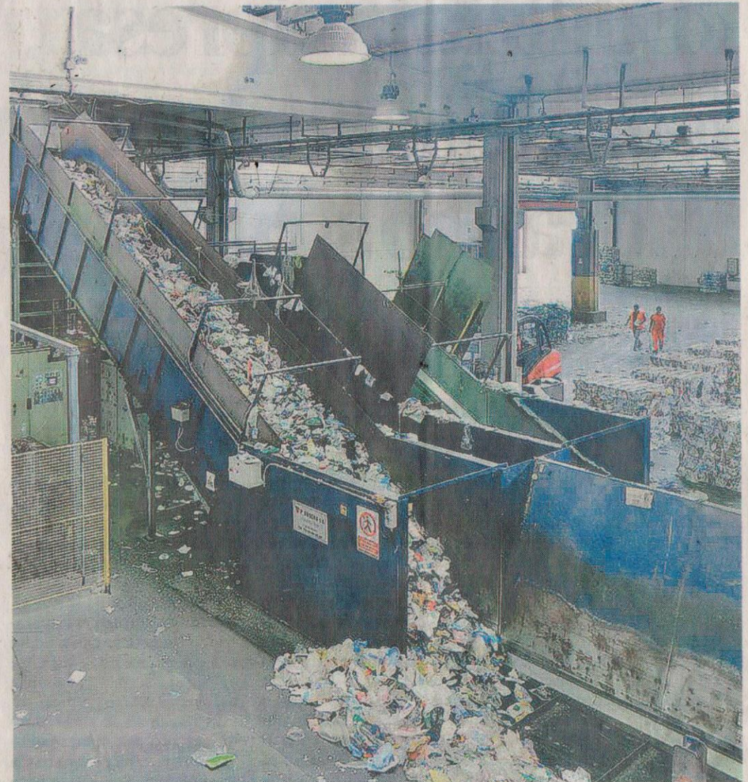
Nei prossimi 18 mesi aziende protagoniste nel percorso per ridurre l'uso di imballaggi e materie plastiche