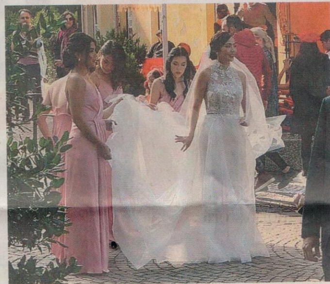
Il matrimonio di una coppia indonesiana a Bellano