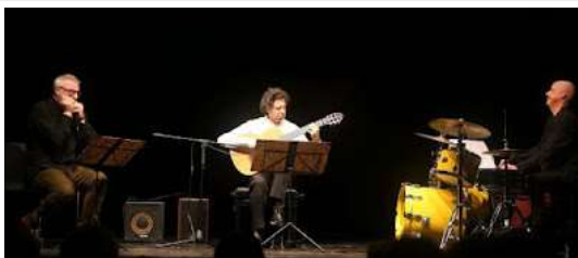
De Aloe, Porroni e Bradascio saranno questa sera a Villa Cipressi di Varenna.

Stasera a Varenna, giovedì 5 a Barzio. Agosto in musica con il Festival "Tra lago e monti"