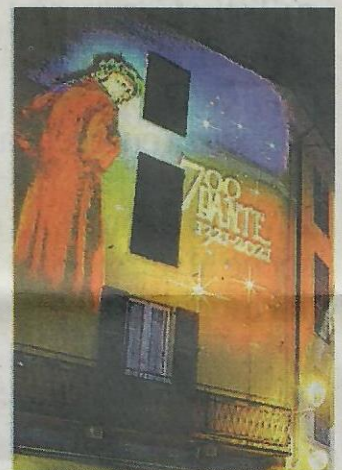
Anche Dante tra le "dediche"