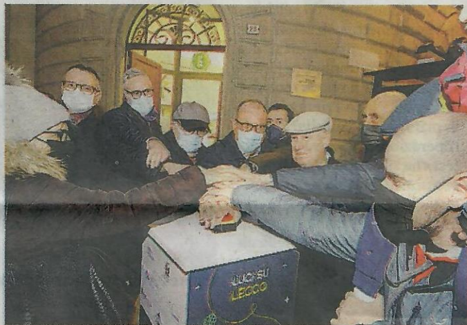
Il momento dell'accensione: gli "sponsor" e i "soci" danno il via