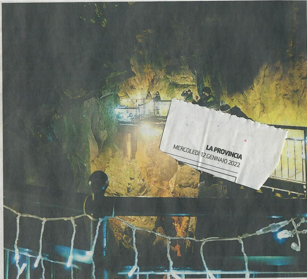
Visite serali all'Orrido di Bellano. L'attrazione continua a macinare nuovi record di gradimento