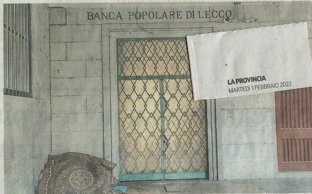
Il giaciglio ripiegato di uno dei due clochard MENEGAZZO