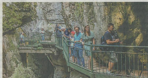
Il borgo di Bellano e il suo Orrido protagonisti domani sulla Rai

stanti 68mila saranno a carico del Comune di Bellano.