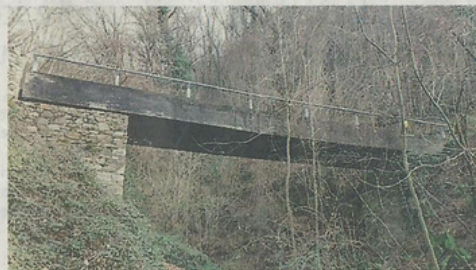
Il ponte Val Grande

La spesa complessiva per la realizzazione del progetto è di 610mila euro, 542mila dei quali saranno finanziati dal bando regionale, mentre i re-