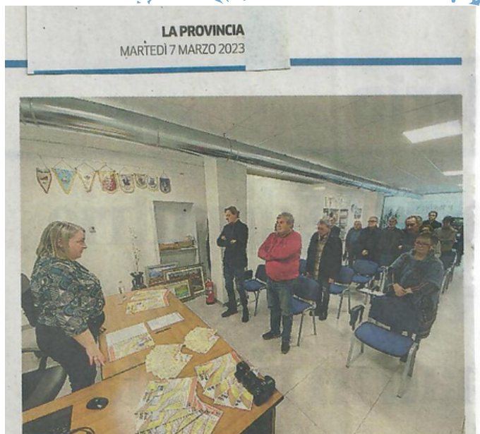
Un'assemblea della Pro loco