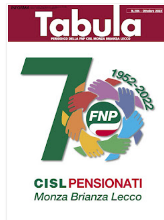
PERIODICO DELLA FNP CISL MONZA BRIANZA LECCO