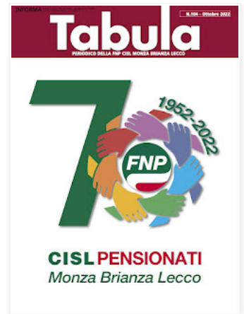
PERIODICO DELLA FNP CISL MONZA BRIANZA LECCO