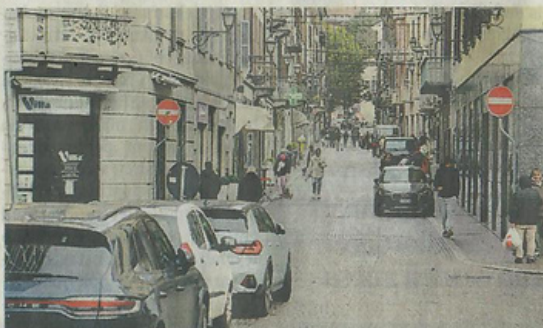
Nel centro di Lecco affitti fuori controllo