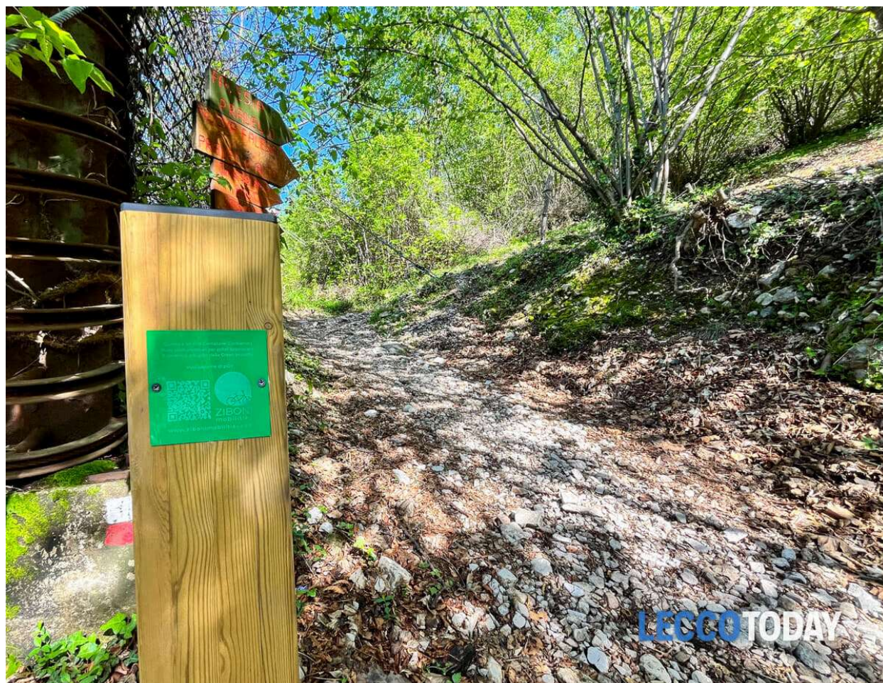
La colonnina all'inizio sul Sentiero del Viandante