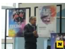
I tre padiglioni che verranno allestiti alla Piccola e che ospiteranno la Mostra 'Il Bel Pianeta'