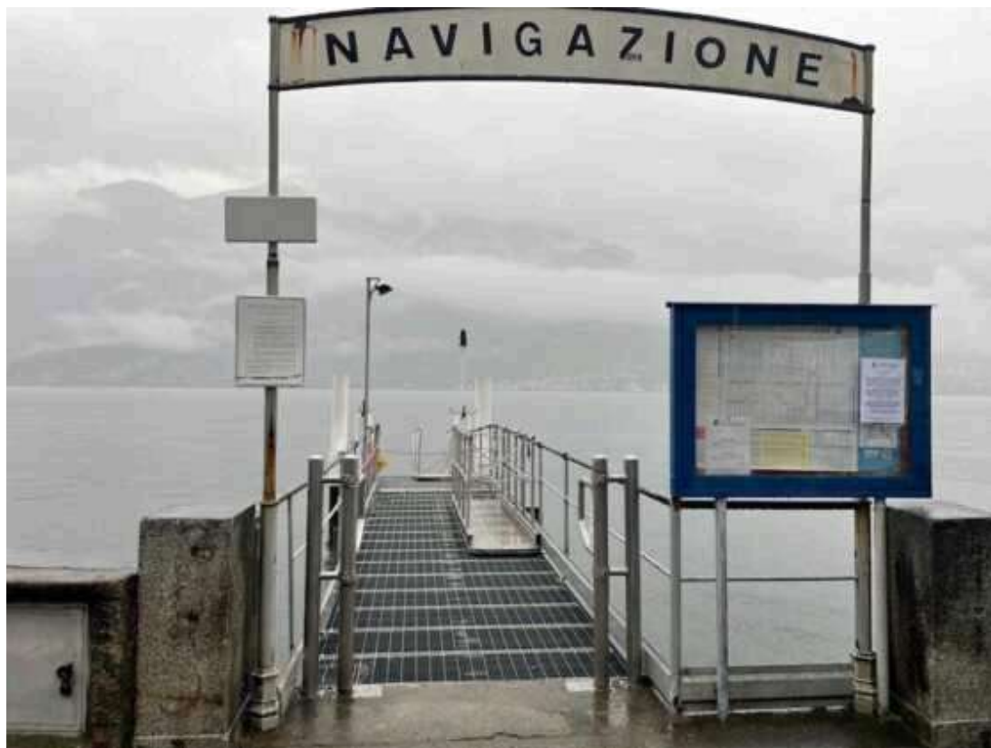
Il pontile di Vassena (Oliveto Lario)