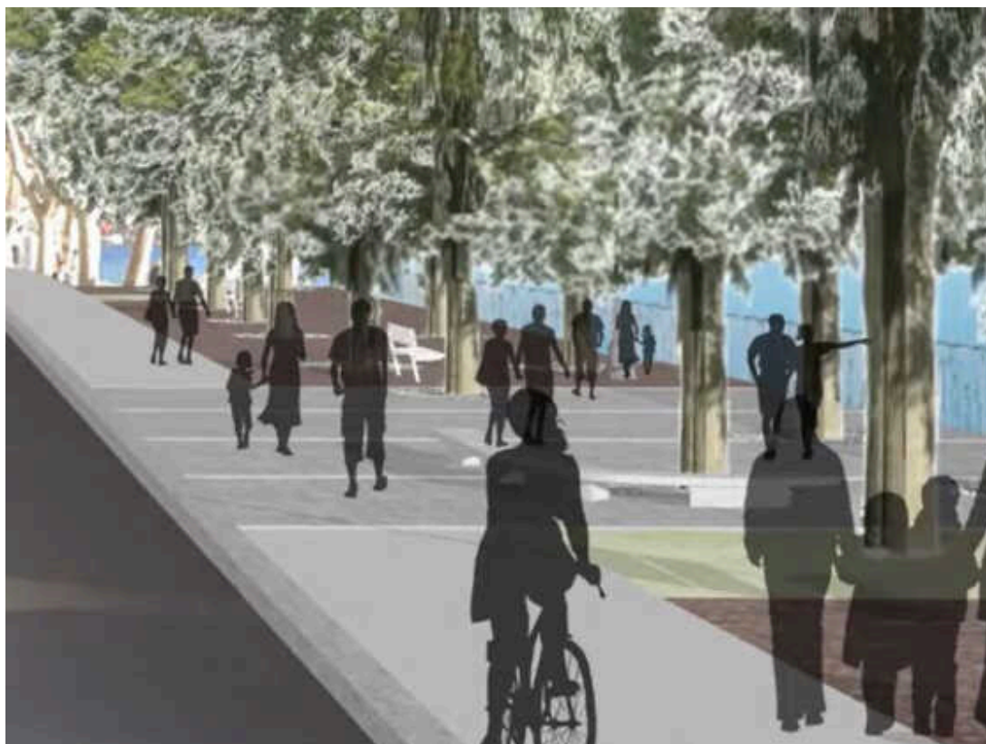
Rendering del progetto definitivo del nuovo lungolago di Lecco