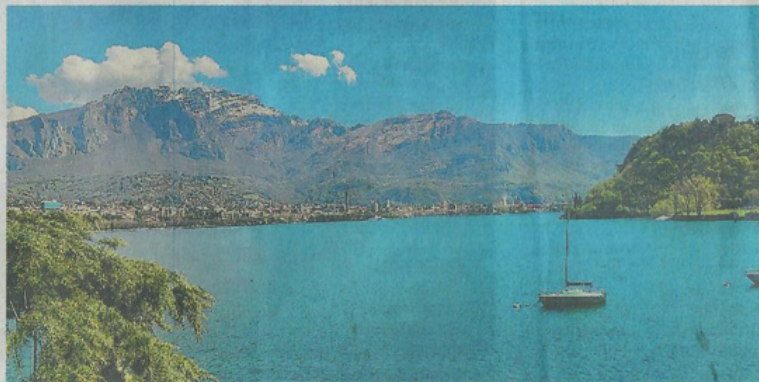
Lo sguardo sul lago: Parè, la baia, gli sport e la ricettività