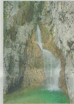
Cascate sul sentiero delle Vasche