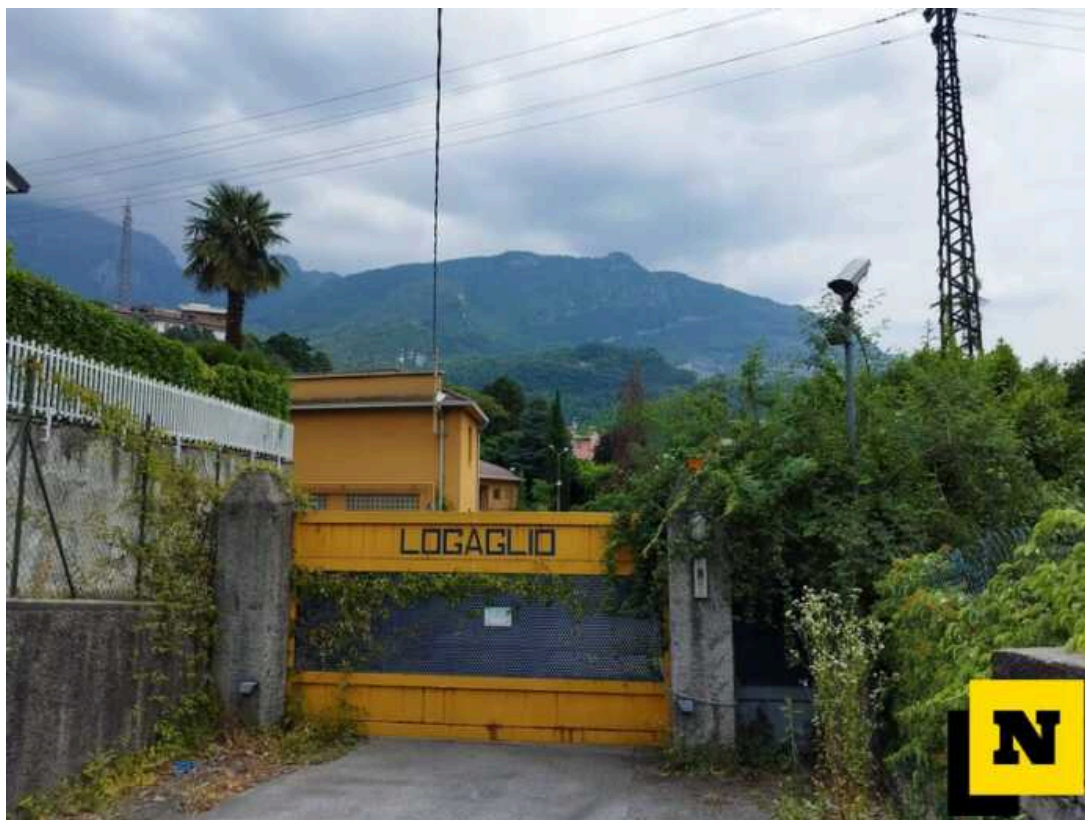
L'area della ex ditta chimica Logaglio

“E’ una grande soddisfazione – il commento del sindaco di Lecco Mauro Gattinoni – in un biennio siamo riusciti ad avviare già una decina di interventi urbanistici, credo sia un segno positivo: la città si è messa in moto, pubblico e privato insieme hanno colto positivamente questa apertura offerta dalla rigenerazione urbana e stanno contribuendo alle progettualità”.