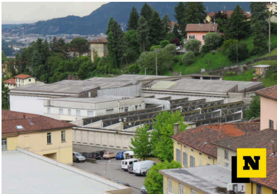
L'ex Vellutificio Redaelli a Rancio

Entro la fine dell'anno dovrebbero iniziare i lavori che cambieranno volto all'area ex Odobez in via Gorizia : qui nasceranno tre nuove palazzine residenziali ma anche un parcheggio ad uso pubblico, un'area verde fruibile dai cittadini e un percorso pedonale lungo il fiume Gerenzone. La proposta di intervento è già stata approvata dalla Giunta, si attende ora il passaggio in Consiglio Comunale.