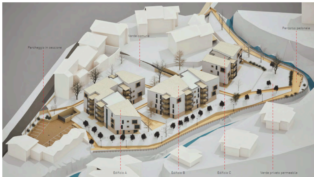
L'area ex Odobez post intervento in un modello 3D

Prosegue anche il cantiere in via Corti a Pescarenico dove è in corso il restauro, sempre ad uso residenziale, di un vecchio edificio settecentesco.