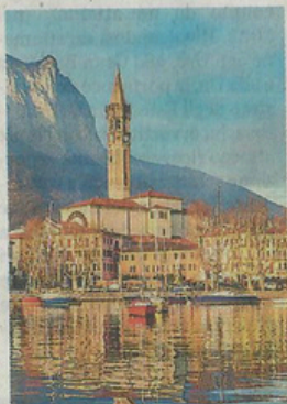
Tanti appartamenti sfitti a Lecco

In trenta comuni su ottantaquattro, l'incidenza delle "abitazioni non occupate" sul totale è superiore al 50%, il che significa che più della metà delle case non sono occupate in misura permanente da almeno una persona.