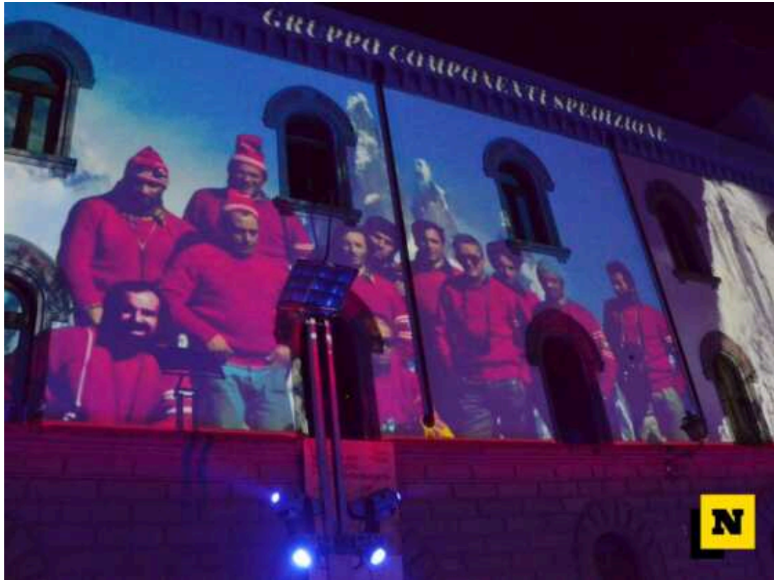
La proiezione su Palazzo delle Paure presentata oggi segna l'inizio delle celebrazioni del 50° del Cerro Torre