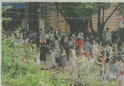
La stazione di Varenna-Perledo presa d'assalto