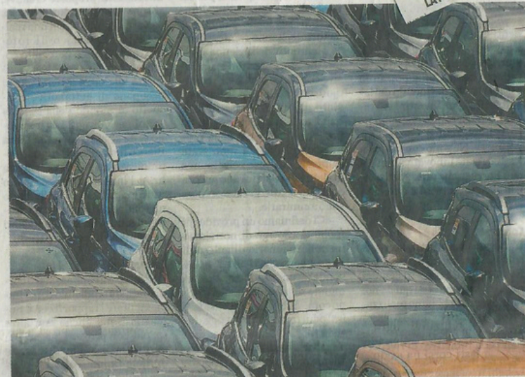
Maggio segna una lieve frenata, ma il soldo da inizio anno è ampiamente positivo