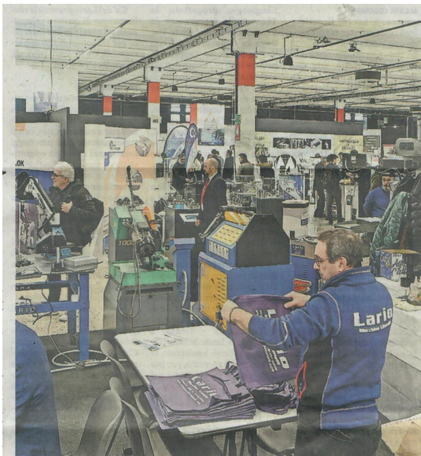
L'ultima edizione di Fornitore Offresi, andata in scena a Lariofiere