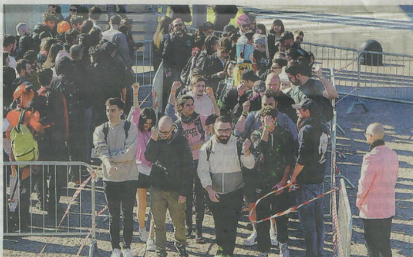
Decisivo anche l'aumento di attività extra economiche: è il caso di Como Fun (qui le code all'ingresso)