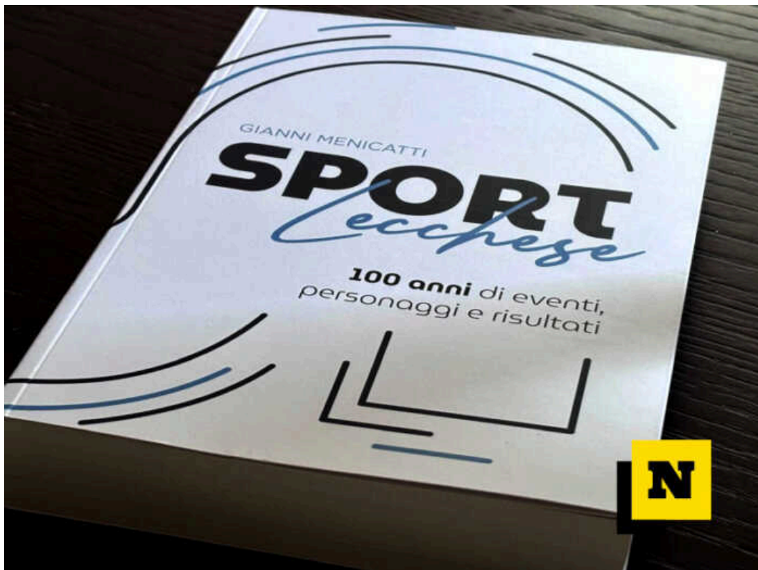
La copertina del libro "Sport Lecchese. 100 anni di eventi, personaggi e risultati"

Un lavoro poderoso quello di Menicatti realizzato grazie ad un lungo lavoro di ricerca da "topo di biblioteca", come lui stesso ieri sera lo ha ricordato, svolto consultando libri, archivi di società sportive, annuari delle varie Federazioni Sportive e contattando numerosissime persone.